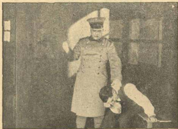
Besøget i Cellen.