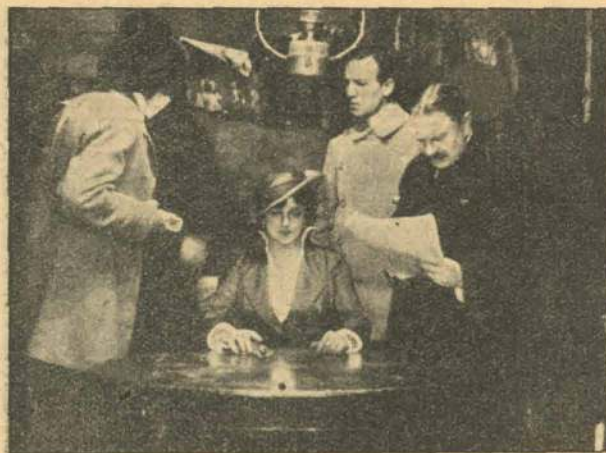
Den kvindelige Spion arbejder.

Nogle Dage efter dette kommer Løjtnant Richard i en slem Knibe. Det er Spillegæld, som han ikke ser sig i Stand til at betale. Hos en Penge-