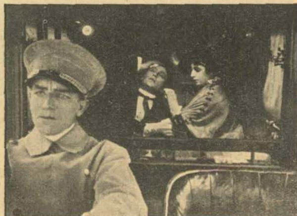
Hvad der skete i Bilen.

Han bliver overfaldet af nogle af den kvinde-