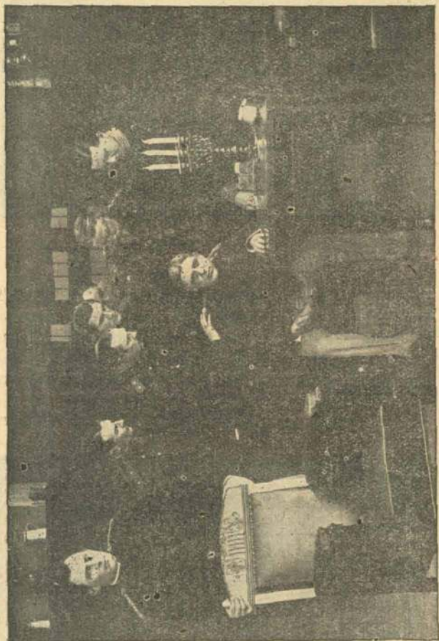
Skandalen paa Regimentskontoret.

Dagen, hvor Løjtnant Richards Forlovelse skal deklareres, er oprunden, urolig gaar Richard frem og tilbage i Selskabet, frygtende Lanciers Trusel. Og hans Frygt viser sig begrundet, thi da